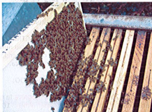
GLOMERE CON REGINA INGABBIATA SUL DIAFRAMMA.

Durante il blocco estivo, il diaframma andrà posizionato fra il primo e il secondo telaino con covata .