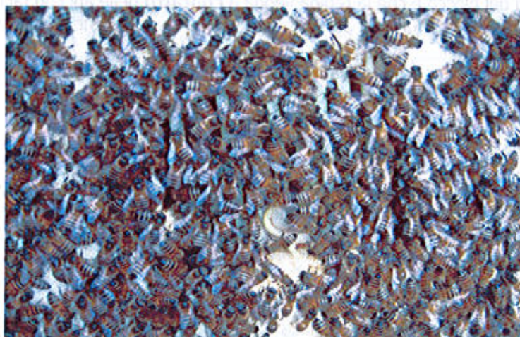
API IN GLOMERE CHE RISCALDANO LA REGINA IN GABBETTA.

La regina anche se in gabbietta verrà stimolata a deporre aumentando di peso e favorendone l'accettazione.